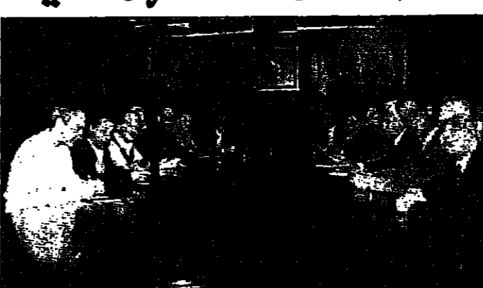
لجنة اللقاء المسيحي مع الهيئة التنفيذية للقوات